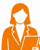
Secretários de Estado