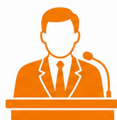
Deputados Estaduais e Federais