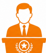
Governadores e Vice-Governadores

Para fins eleitorais, o conceito é muito mais amplo do que você imagina