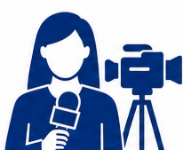
Jornalistas e Assessores de Comunicação