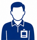
Comissionados e Contratados Temporários