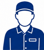
Terceirizados em Função Pública